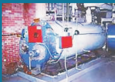
Chống cặn cho lò hơi