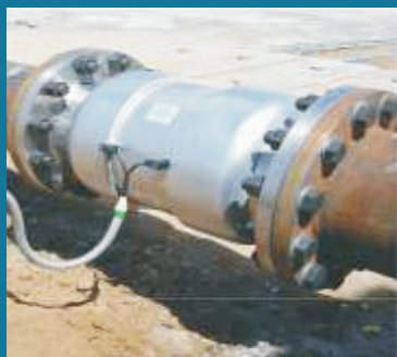
Chống cặn đường ống Dầu, Nước ...

Thiết bị TWT có tần số hoạt động từ 2000Hz đến 7000Hz (đây là khoản tần số tối ưu nhất để ức chế cặn) và biên độ từ 25mA đến 250mA . Hầu hết các thiết bị sóng tam giác khác có tần số hoạt động từ 2500Hz đến 7000Hz do đó khả năng xử lý và ức chế cặn của thiết bị TWT cao hơn do phạm vi tần số được cải tiến để tác động đến các phân tử cặn ở tất cả các kích thước khác nhau.