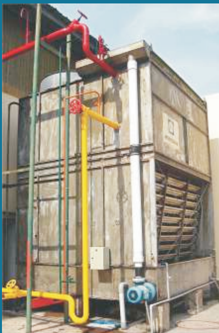
Chống cặn cho Giàn Ngưng